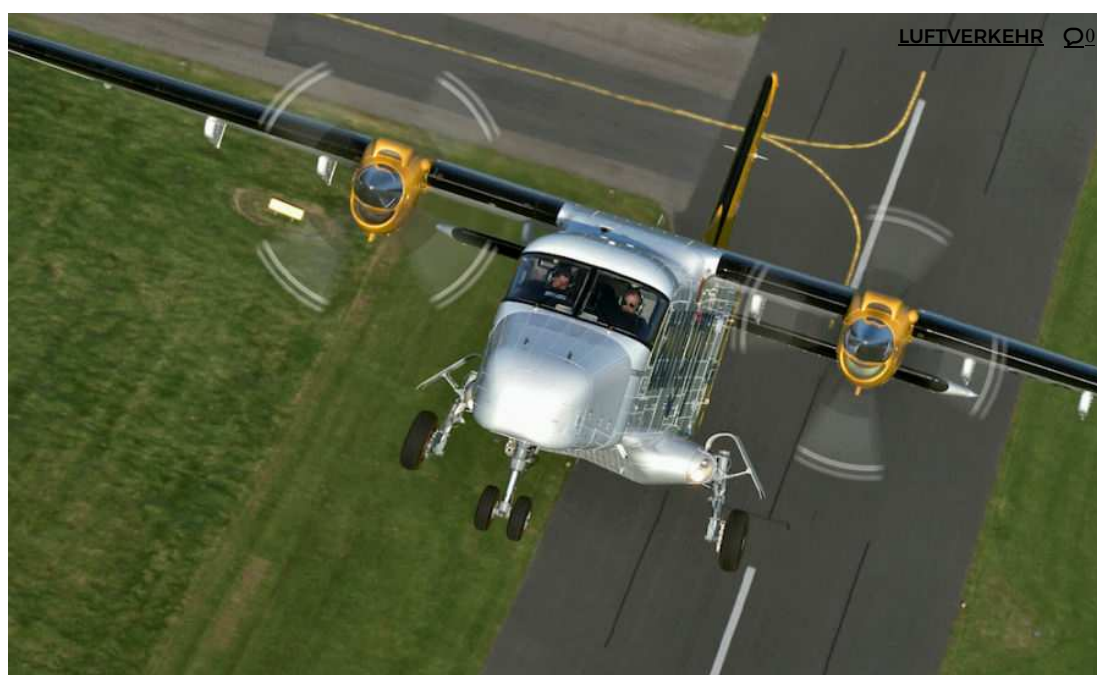
Die Dornier 228 zeichnet sich durch hervorragende Kurzstarteigenschaften aus.

Die Regionallfluggesellschaft Aurigny Air Services hat ihre Flotte um eine werksneue Dornier 228 von RUAG Aviation aus Oberpfaffenhofen ergänzt.