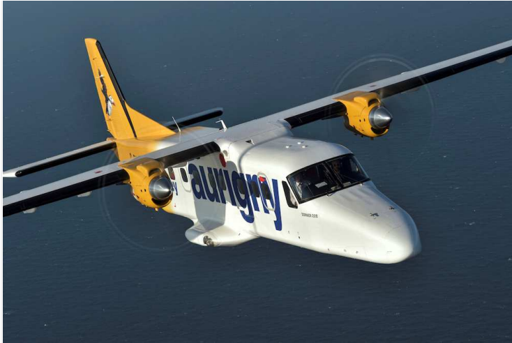
Aurigny Air Services hat von RUAG Aviation in Oberpfaffenhofen eine zweite Dornier 228 übernommen.